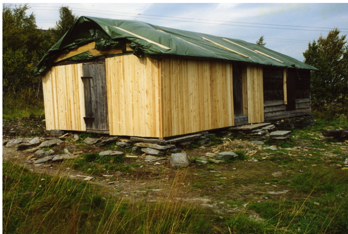
Seterstuggu Quintusvollen